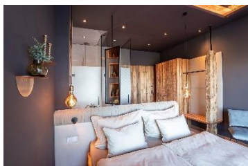
Zimmer und Suiten im hochwertigen Alpinstil