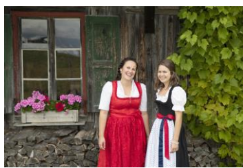
Gemütlich Berggipfelblicke genießen