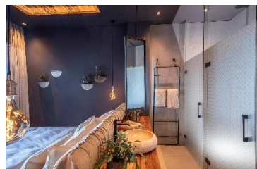
Gedecktes Farbkonzept für den erholsamen Urlaub