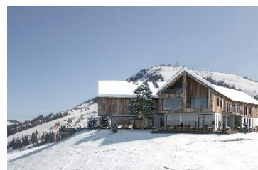
Die Kraftalm. Ein neues Haus, dieselbe Alm.