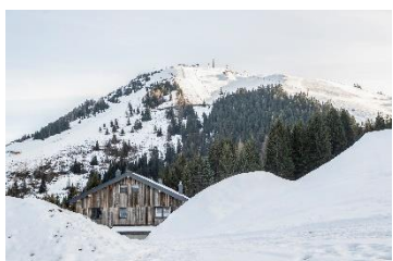
Die Kraftalm mitten in der Skiwelt Wilder Kaiser Brixental