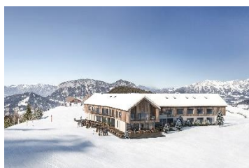
Die neue Kraftalm. Almhotel und moderne Skihütte